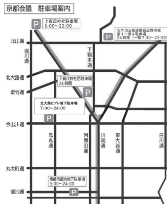
地下鉄マップ・近隣駐車場ののご案内

※駐車料金は価格改定等の事情により変更する場合がございます。その旨ご了承ください。 ※上賀茂神社・下鴨神社駐車場からはタクシー(約1,800円)をご利用ください。 ※掲載のほかにも、地下鉄沿線には多数の駐車場がございますのでご利用ください。