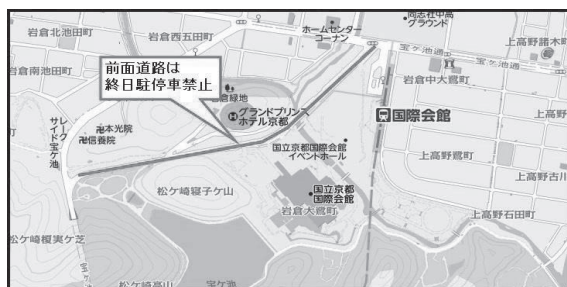
地下鉄マップ・近隣駐車場のご案内