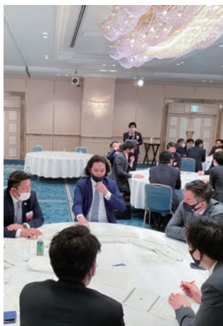
議論するメンバーら

なお、本例会は、開催日直前、新型コロナウイルス感染拡大の影響により、講師がウェブでのご参加となり、講師はウエブ、メンバーはリアルウエブ、という新しい形式での開催となりました。会場参加のメンバーは、ウエブを通して講師との質疑をおこない、それを見ながら、ウエブ参加のメンバーは、ズーム上の各ブレイクアウトルームで議論や講師との議論をおこないました。例会運営の新しい形も垣間見えた例会となりました。