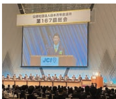
会員拡大委員会による拡大セミナー第二部の様子

一般社団法人城陽青年会議所 創立40周年記念式典 2021年4月4日(日) 文化パルク城陽ふれあいホール