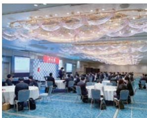
ウェブ+リアルでの開催